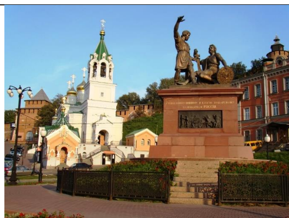
В Нижнем Новгороде